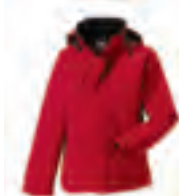
510 Hydraplus 2000

Unter der Bezeichnung Softshell und Sportshell finden Sie besonders vielseitige Jackenmodelle. Die wasserdichten, atmungsaktiven Materialien dieser Linie präsentieren sich in einem attraktiven, dynamischen Look und passen sich hervorragend an die jeweilige Aktivität des Trägers an.