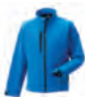
140 Soft Shell Jacke

Unter der Bezeichnung Softshell und Sportshell finden Sie besonders vielseitige Jackenmodelle. Die wasserdichten, atmungsaktiven Materialien dieser Linie präsentieren sich in einem attraktiven, dynamischen Look und passen sich hervorragend an die jeweilige Aktivität des Trägers an.