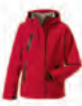
540 Sport Tech 10000