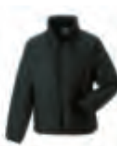
530 Gefütterte Wärmejacke

Funktion Plus , dies sind die technologisch innovativsten Jacken in unserem Sortiment. Sie sind extrem windabweisend, wasserdicht sowie atmungsaktiv und eignen sich für den Einsatz bei härtesten Wetterbedingungen. Die perfekte Wahl, wenn es gilt, sich bei der Arbeit vor Kälte, starkem Wind und intensivem Regen zu schützen, ohne Abstriche beim Tragekomfort zu machen. Und unser 550-GORE-TEX®-Modell ist darüber hinaus optimal geeignet um einen ganz besonderen Eindruck zu hinterlassen.