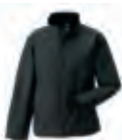
500 Hydra-Shell 2000

Unsere Basis -Jacken sind alles andere als „Einsteigermodelle“. Diese Jacken sind aus hochwertigem, atmungsaktivem, wasserdichtem Material gefertigt und die kritischen Nähte sind alle verschweisst. Sie sind schick, besonders leicht und eignen sich hervorragend für Einsatzbereiche, in denen regelmäßig von drinnen nach draußen gewechselt wird.