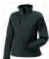
520 Sport Shell 5000

Funktion Plus , dies sind die technologisch innovativsten Jacken in unserem Sortiment. Sie sind extrem windabweisend, wasserdicht sowie atmungsaktiv und eignen sich für den Einsatz bei härtesten Wetterbedingungen. Die perfekte Wahl, wenn es gilt, sich bei der Arbeit vor Kälte, starkem Wind und intensivem Regen zu schützen, ohne Abstriche beim Tragekomfort zu machen. Und unser 550-GORE-TEX®-Modell ist darüber hinaus optimal geeignet um einen ganz besonderen Eindruck zu hinterlassen.